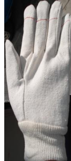
GUANTE DE LONA DOBLE PALMA CÓDIGO: 12-222