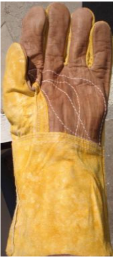
GUANTE MIXTO LARGO CÓDIGO: RIZO 4