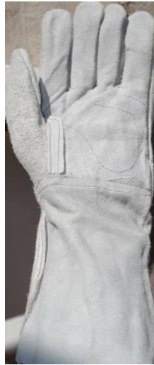
GUANTE DE CARNAZA LARGO CÓDIGO: RIZO 2