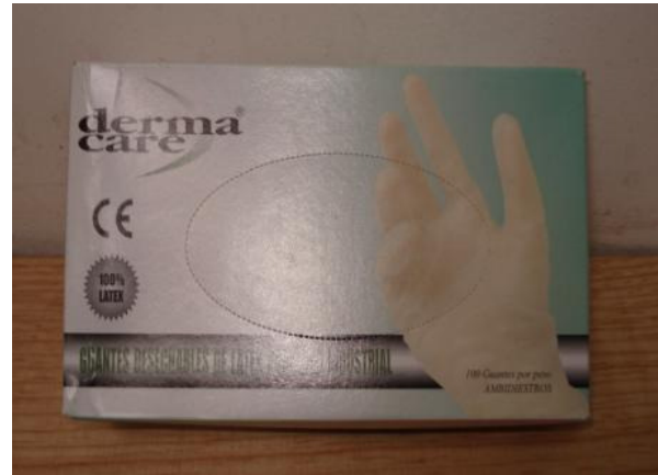
GUANTE LATEX DESECHABLE CON POLVOS CÓDIGO: 56-500