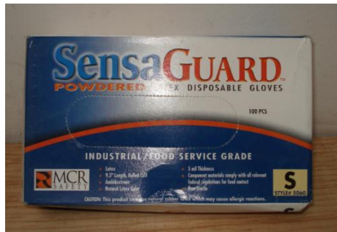
GUANTE LATEX MEMPHIS P/EXAMINAR CÓDIGO: 5060