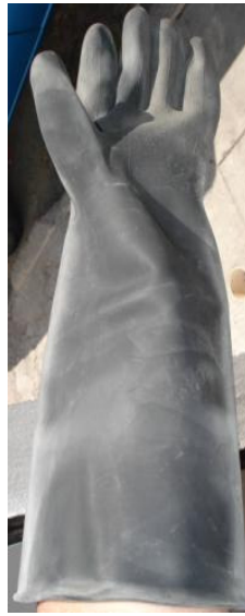
GTE. NEGRO CONTRA VS ACIDOS 18" L CÓDIGO: 56-450