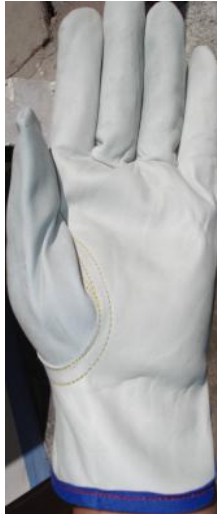
GUANTE PIEL OPERADOR C/OVAL CÓDIGO: RIZO 6