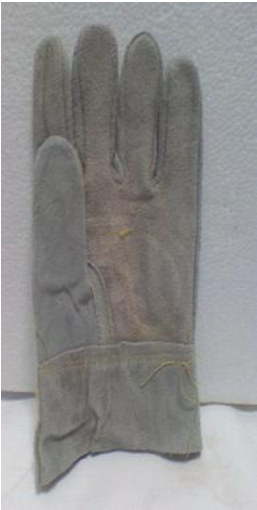
GUANTE DE CARNAZA CORTO CÓDIGO: RIZO 1