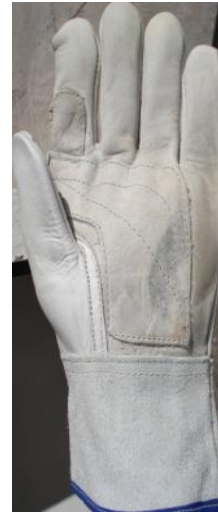
GUANTE MIXTO CORTO CÓDIGO: RIZO 3