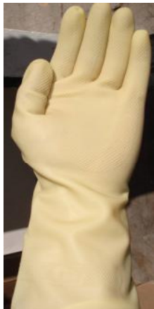
GUANTE LATEX AMARILLO CÓDIGO: 5250 M