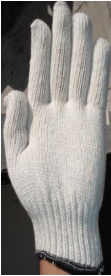
GUANTE JAPONES 3 CABOS A-13 CÓDIGO: A-1005