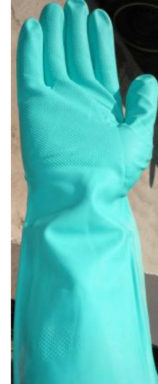
GTE. DE NITRILIO VERDE FLOQUEADO CÓDIGO: 5316 - 5320