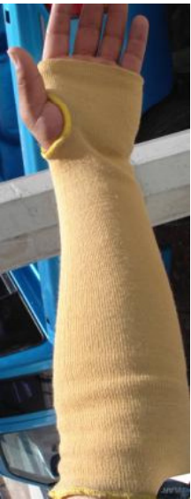
MANGA 100% KEVLAR DE 18" CÓDIGO: MA-K18