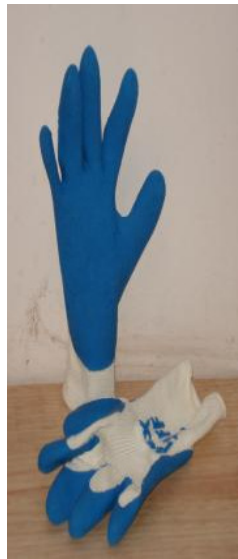
GUANTE FLEX TUFF DE AGARRE II CÓDIGO: 9680