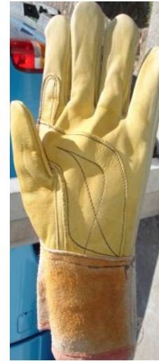
GUANTE TIPO PEMEX CÓDIGO: RIZO 7