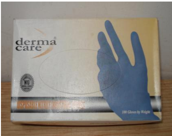
GUANTE NITRILIO DESECHABLE C/TALCO CJA. 100 PZS. CÓDIGO: 67-500