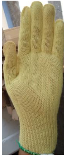
GUANTE 100% KEVLAR DUPONT CÓDIGO: K2200