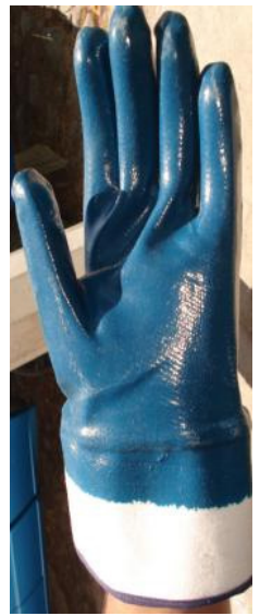
GUANTE NITRILIO AZUL C/LONETA CÓDIGO: 67-805